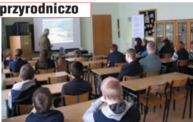
Gimnazjum nr 1 w Olecku.

Konferencji w dniach 15-16 lutego mieliśmy przyjemność odwiedzić wybrane szkoły: SP nr 4, SP nr 5, SP nr 7 oraz I LO z Elku. Podczas wykładu w siedzibie CEE uczestnikami były: SP nr 2, ZS nr 6 oraz ZS nr 3 z Elku. Z kolei we wtorek gościliśmy w czterech szkołach powiatu oleckiego i gołdapskiego, takich jak: Gimnazjum nr 2 w Olecku, SP nr 3 w Gołdapi, ZS w Judzikach oraz Zespole Szkół Licealnych i Zawodowych w Olecku.