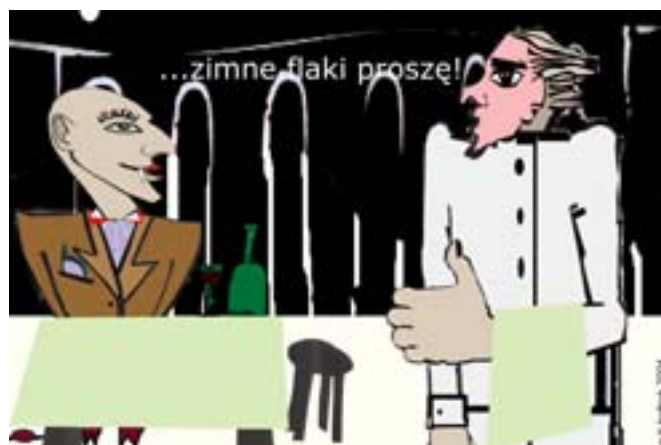
Rys. Wiesław B. Boltryk