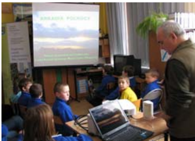
Zespół Szkół w Judzikach.