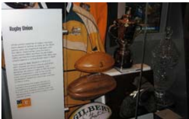
W Muzeum Sportu.

W Nowej Południowej Walii (będę tam za dwa dni) i Queenslandzie najpopularniejszą dyscypliną jest rugby. To ze-