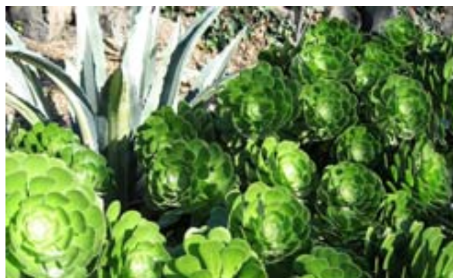
Roślinność w jednym z parków miejskich.

wowych). To bardzo szybka gra, w której dozwolone jest atakowanie gracza, w którego posiadaniu jest piłka, poprzez: chwyt, szarżę, pchnięcie od przodu lub z boku. Niedozwolone jest popychanie w plecy, uderzenia, atakowanie powyżej ramion i poniżej kolan. Poza tym można blokować wszystkich zawodników znajdujących się 5 m od gracza niosącego piłkę. Piłka może być podawana w dowolnym kierunku poprzez jej kop-