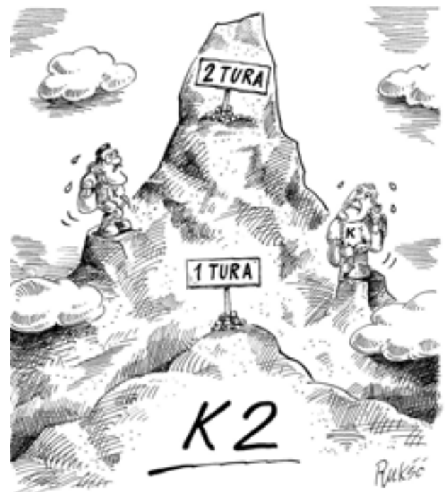
Rys. Waldemar Ruksc.

MTL Creation, tel. 600 936 589, www.mtl.olecko.pl