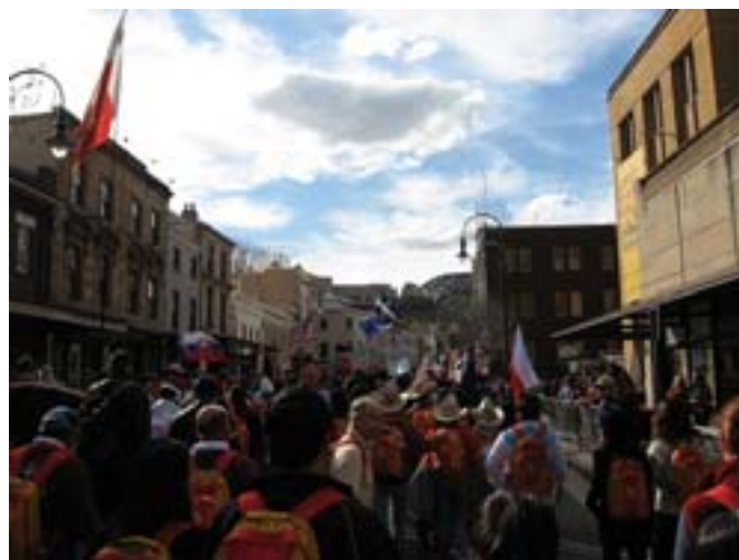
Przemarsz ulicami Sydney.

kolorowym pochodzie na duży plac Barangaroo. Wejście 6, sektor E-2. Dość dużo ludzi. Papież przyплыł statkiem i odbyło się uroczyste powitanie. Nie widziałem jakoś entu- zjazmu, oznak radości. Wszystko to było zwyczajne i proste. Jakby codzienność. Papież przy ołtarzu, a pielgrzymi w tej samej chwili jedli kolację rozdawaną przy sektorach i grali w karty... Relacje w telewizji wyglądają znacznie lepiej. To nie to samo co spotkania z Janem Pawłem II. Różnica ogromna, zresztą papież nie jest dobrze odbierany w tym kraju. Przy okazji wizyty Benedykta XVI australijska prasa ujawnia wszelkie skandale na tle seksualnym z udziałem księży. Ale zwykli ludzie bardzo życzliwie reagują na obecność papieża i z ser- decznością odnoszą się do katolików. W jednej z miejsco- wych gazet pod zdjęciem pielgrzymów widnieje napis: Po- wszechna histeria. Organizacja tego spotkania, jak i wielu innych, przebiegała sprawnie. Pracuje mnóstwo wolontariu- szy. Zaangażowana jest policja i wszystkie służby.