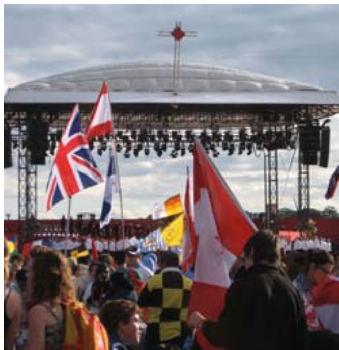
Ołtarz papieski na Barangaroo.

Jakimiś okrężnymi drogami trafiliśmy do Bankstown (a miało być krócej...) i doszliśmy do wniosku, że lepiej bę- dzie jak pojedziemy autobusem. Tak też zrobiliśmy. Autobu- sem linii 905 dojechaliliśmy pod sam kościół w Georges Hall. Oczywiście spóźniliśmy się na katechezę i to pół godziny. Obiad w postaci pakietu, tu, na miejscu. Później pojechali- śmy pociągiem do centrum Sydney (stacja Circular Quay Stadion) na spotkanie z papieżem. Przeszliśmy ulicami w